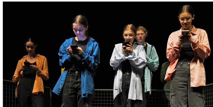
DS Trma-vrma, Spojená škola, Letná ul. ZUŠ, Poprad: inscenácia NULY A JEDNOTKY