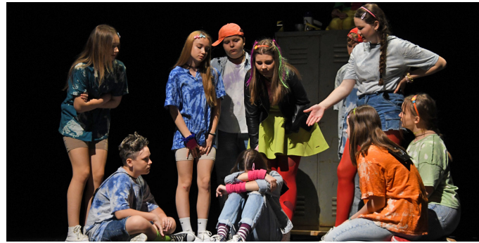
DDS Bodka, ZUŠ, Veľký Krtíš: inscenácia ÚSCHOVŇA