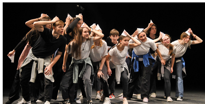
DDS Bebčina, ZUŠ Š.Baláža, Nová Dubnica: inscenácia ALBUM