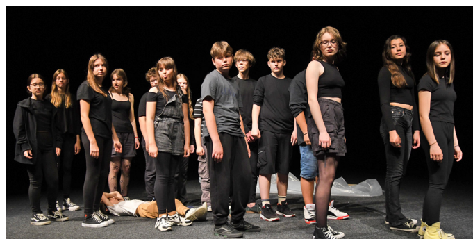
Divadlo FALANGIR, Kostolište: inscenácia SPOJENIA