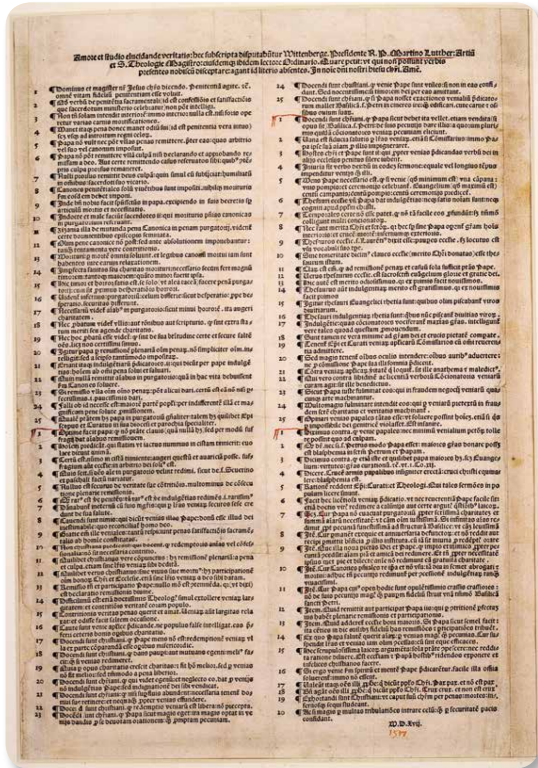
95 téz Martina Luthera, Štátna knižnica Berlín