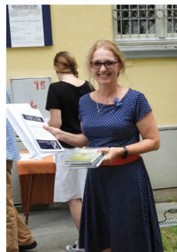
Jedna z ocenených autoriek.