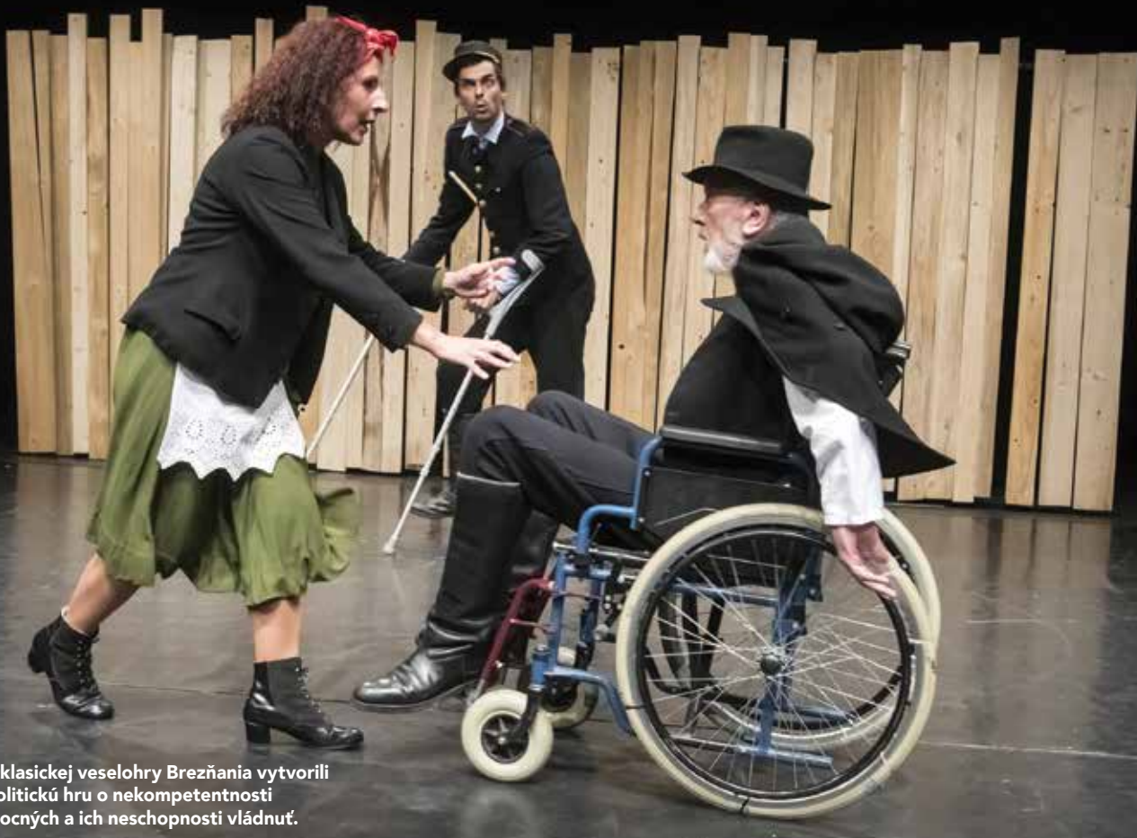
Z klasickej veselohry Brezňania vytvorili politickú hru o nekompetentnosti mocných a ich neschopnosti vládnuť.