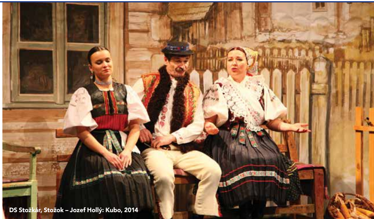
DS Stožkár, Stožok – Jozef Hollý: Kubo, 2014

skú tragédiu, udalosti súvisiace s vysviackou kostola v dedine pri Ružomberku 27. októbra 1907. Hra sa, samozrejme, nedostala počas Rakúsko-Uhorska na javiská, ba dokonca autor ju radšej publikoval v českom časopise Naše Slovensko pod pseudonymom Sergej Tritonovič.