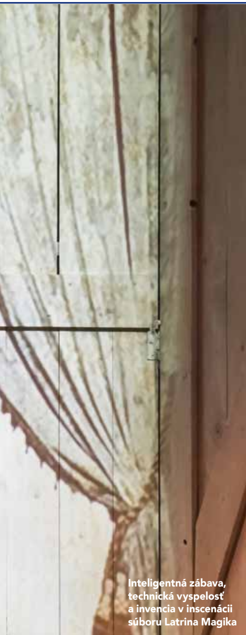
Inteligentná zábava, technická vyspelosť a invencia v inscenácii súboru Latrina Magika