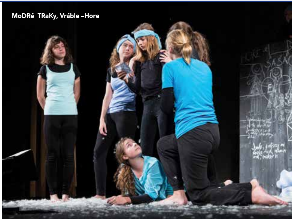
MoDRé TRaKy, Vráble –Hore

ale aj kultúrno-spoločenský život a tiež pracovný proces. O tom niet pochýb. To, čo v amatérskom, respektíve neprofesionálnom umení (aby sme použili najnovší termín) chýbalo dlhé roky, bolo prepojenie jednotlivých umeleckých oblastí. Deficit pocítujeme už niekoľko rokov, lebo prehliadky a súťaže sa konajú paralelne, mnohé približne v rovnakých termínoch a sledovanie viacerých oblastí je tak veľmi sťažené. Pritom vzájomné poznanie a inšpirovanie môže pomáhať ďalšiemu rozvoju jednotlivých oblastí aj kultúre ako celku.