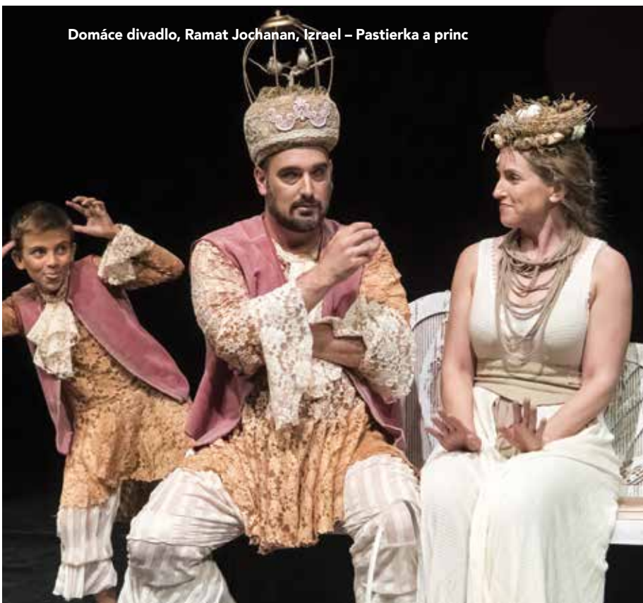
Domáce divadlo, Ramat Jochanan, Izrael – Pastierka a princ

Z celkového hľadiska možno tohtoročnú SŽ hodnotiť ako festival, ktorý rozhodne ponúka niekoľko podstatných tém na diskusiu. Jednak tému o ňom samom, jednak o prostredí, v akom funguje. Stačí si porovnať rozpočty, šírku organizačného tímu, počet partnerov a počet inscenácií na Jiráskovom Hronove a na Scénickej žatve. Sú to počty akoby z dvoch rôznych vesmírov. Napriek tomu sa festivalu, respektíve súborom darí držať si umeleckú kvalitu európskej úrovne. Táto úroveň však nie je výsledkom systému, ktorý ju podporuje, ale osobného vkladu jednotlivcov. Do budúcich ročníkov by preto bolo vhodné, keby festival bol v prvom rade platformou, ktorá umožňuje čoraz väčšiemu počtu súborov konfrontovať sa, zároveň však musí byť miestom, ktoré bude (po vecných, argumentačne silných diskusiách na jeho pôde) formulovať myšlienky a požiadavky neprofesionálnych divadelníkov Národnému osvetovému centru, ale aj krajským štruktúram. ■