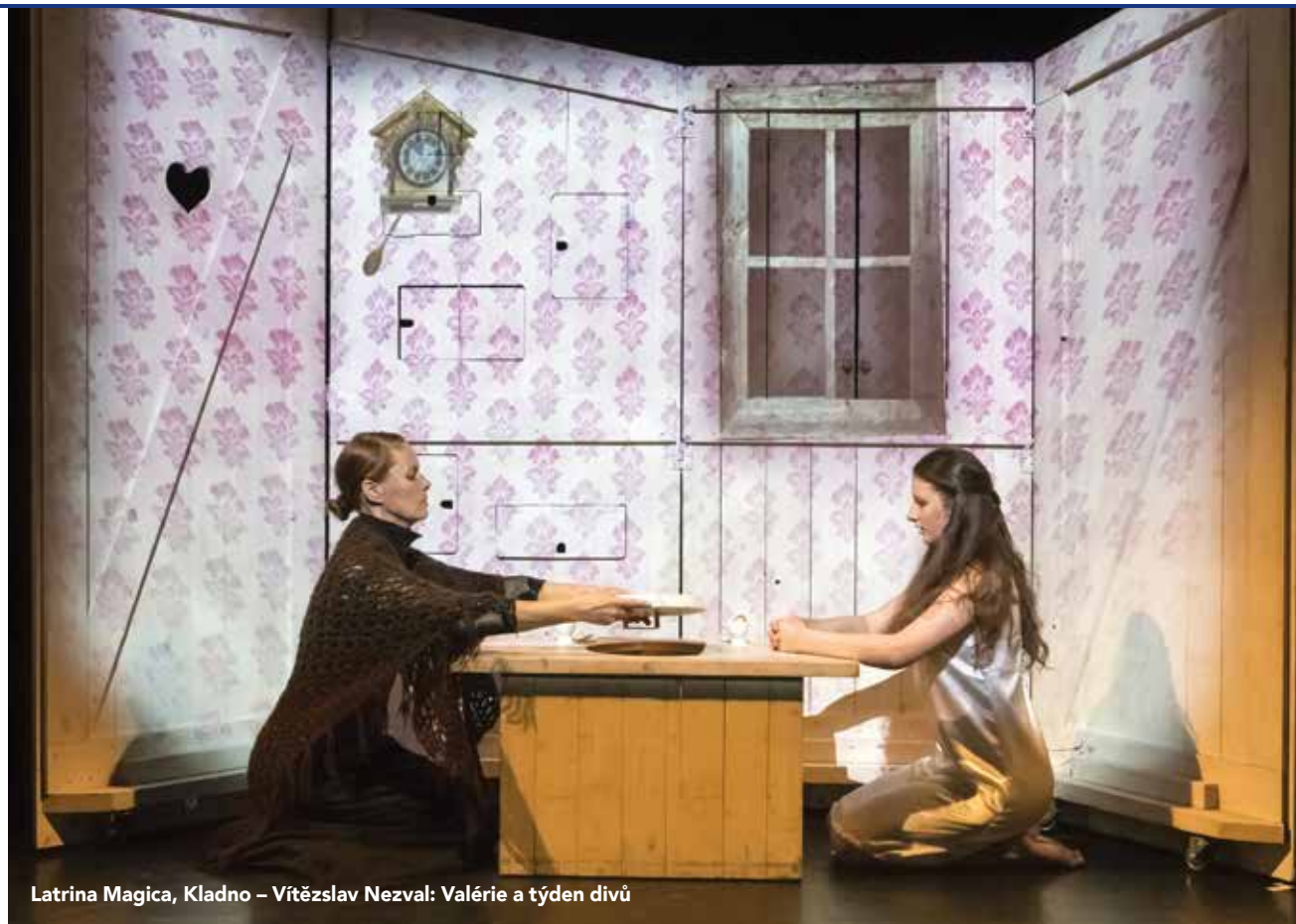
Latrina Magica, Kladno – Vítězslav Nezval: Valérie a týden divů

by bolo následne uvedené aj vo festivalovom bulletinu a dotýčny navrhovateľ by moderoval aj diskusiu so súborom. Nepochybne by to prospelo jednak poučenejšiemu prijatiu naším publikom, ale aj serióznosti výberu. Dalo by sa tak vyhnúť podobnej nevyrovnanosti, ako to bolo počas tohto ročníka. Na jednej strane sme mali možnosť vidieť súbor Latrina Magika z Kladna. Ich Valérie a týden divů bola charakteristická sofistikovaným, ale ľahko komunikujúcim humorom, schopnosťou vzdávať poctu, ale zároveň ironizovať rôzne poetiky, klíše a princípy. V kombinácii s remeselne zručným, poučeným a moderným režijným jazykom bola výsledkom mimoriadne inšpiratívna inscenácia. Ibaže v Martine sme videli aj izraelské The Home theatre a ich The Goatherd and the Prince. V tomto prípade súbor bohužiaľ okrem svojho exotického pôvodu nepriniesol nič, čo by malo našich neprofesionálnych divadelníkov inšpirovať či donútiť k novým pohľadom na divadlo. Kdesi