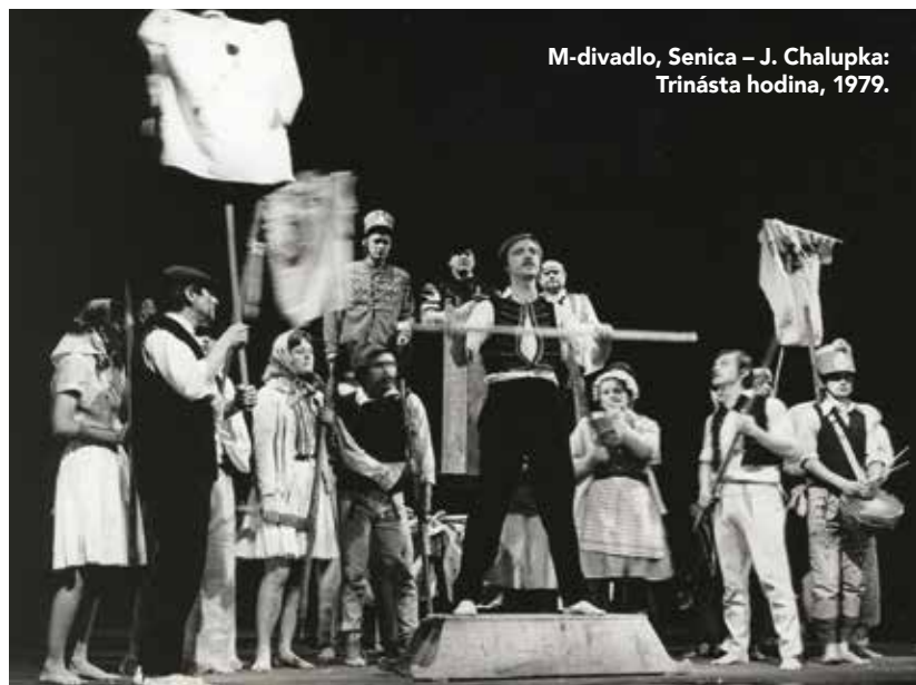
M-divadlo, Senica – J. Chalupka: Trinásta hodina, 1979.

Vydanie knihy hádam nie je posledným komplexným dielom o Lašutovej tvorbe. Teraz je rad na súboroch, aby vydali svoje i Lašutove dejiny. ■