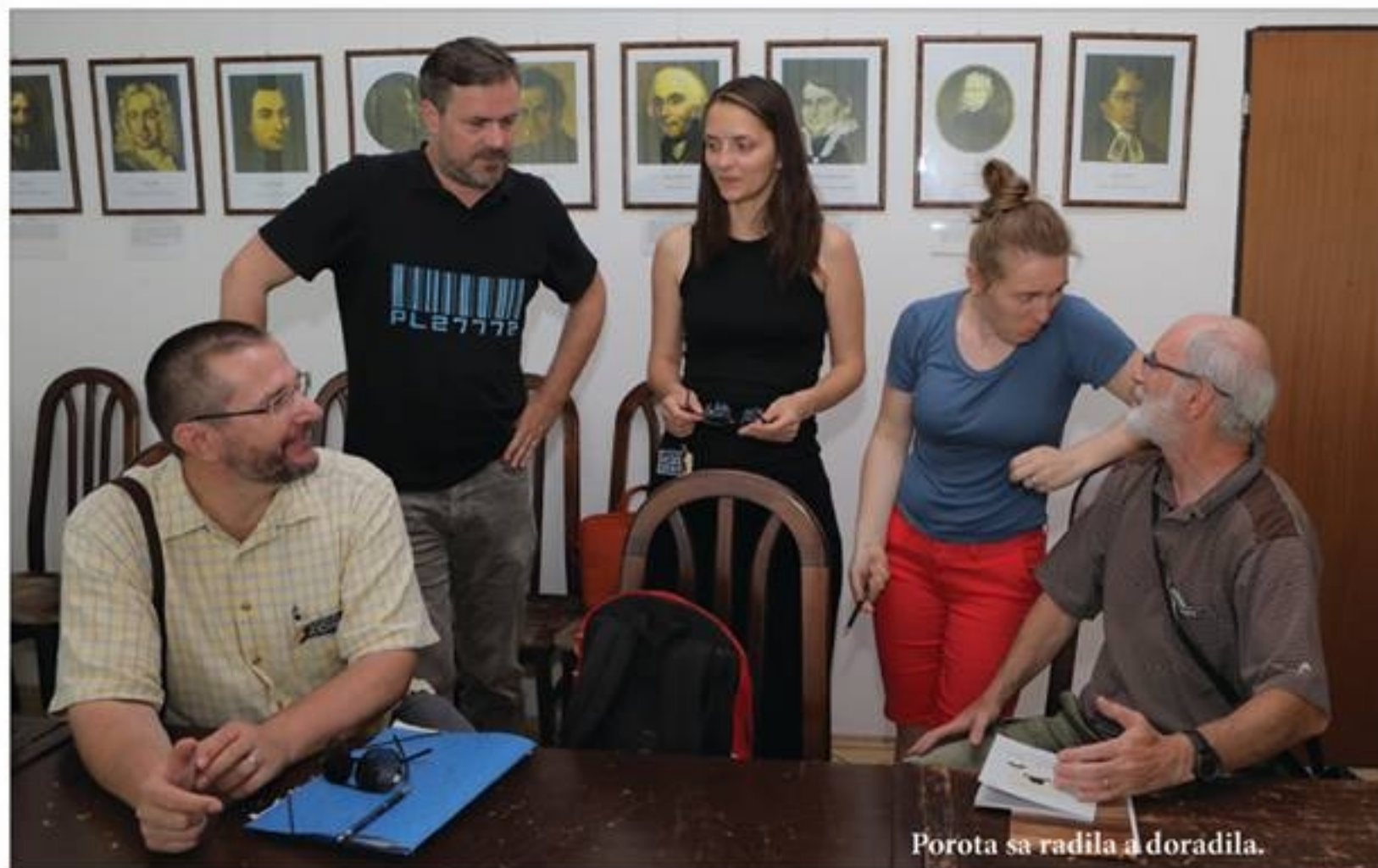
Porota sa radila a doradila.