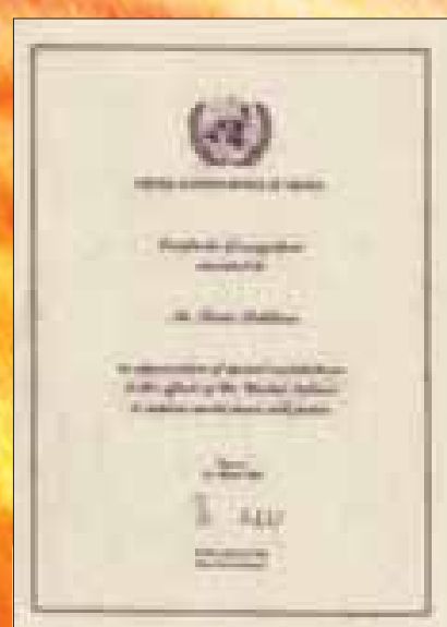
Certifikát Organizácie Spojených národov, Viedeň, 1998