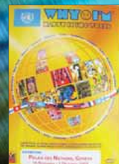
Oficiálny plagát Organizácie Spojených národov k projektu, Ženeva, 2005