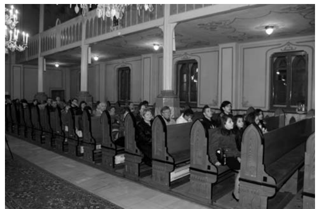
Hľadanie a poznávanie Hviezdoslava v evanjelickom kostole