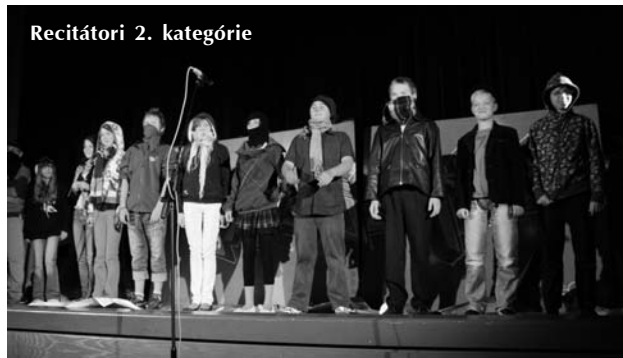
Recitátori 2. kategórie