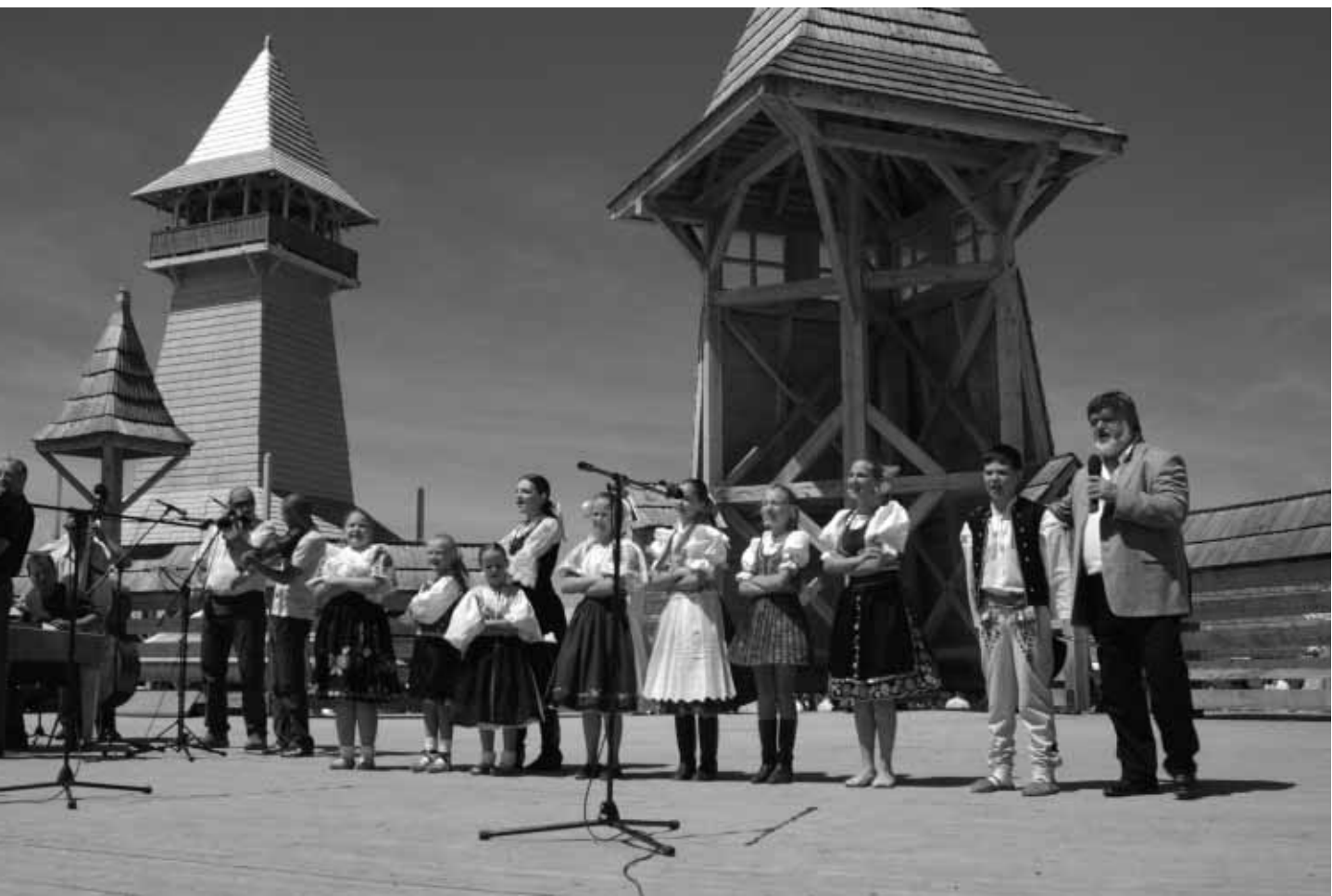
Víťazi detskej speváckej súťaže Slávik Slovenska 2008 s operným spevákom maestrom P. Dvorským na Malej scéne Folklorného festivalu Východná (na mieste bývalej rampy)