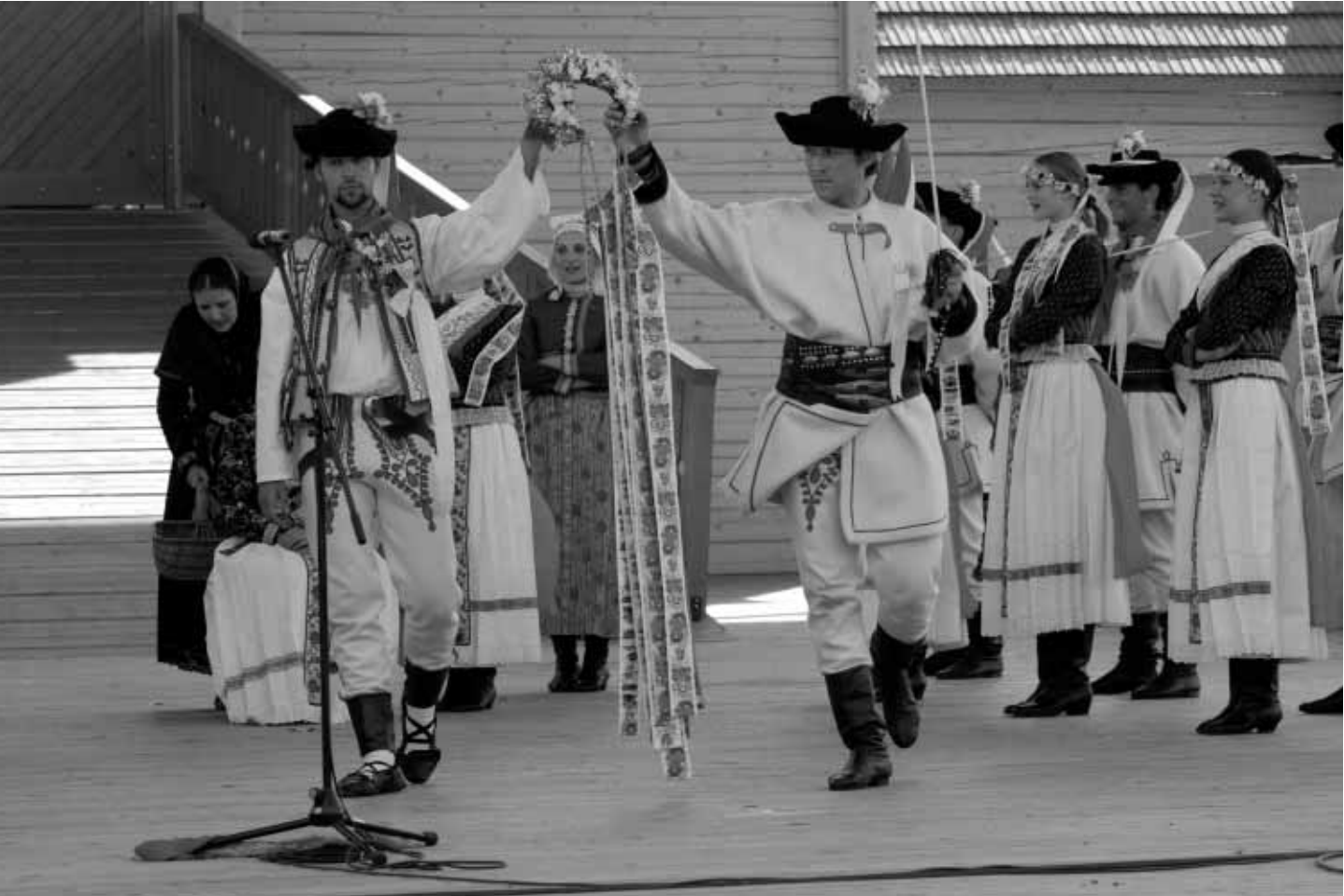
Z programu Ako zvoní život na Hlavnej scéne amfiteátra. Folklorný festival Východná 2008