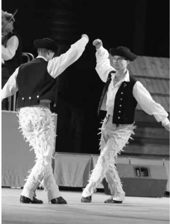
Sen v podaní tanečníčok a tanečníkov SĽUK-u. Sobota