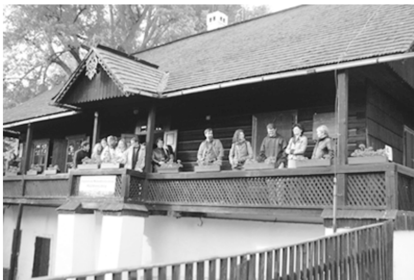
Hviezdoslavov Kubín 2009. Po stopách Hviezdoslava

bolo v publiku až 58 %, čo je istotne fakt potešujúci a svedčiaci o tom, že poézia (aj prednášaná próza) vedie aj v dnešnom čase oslovovať.