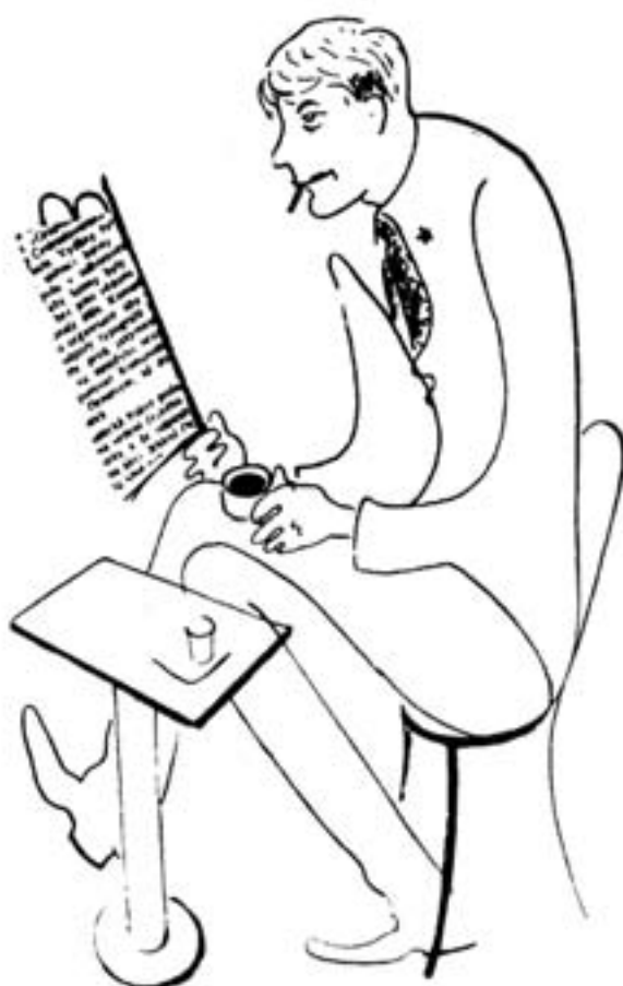
Ladislav Novomeský v karikatúre Ľudmily Rambouskovej (1932)