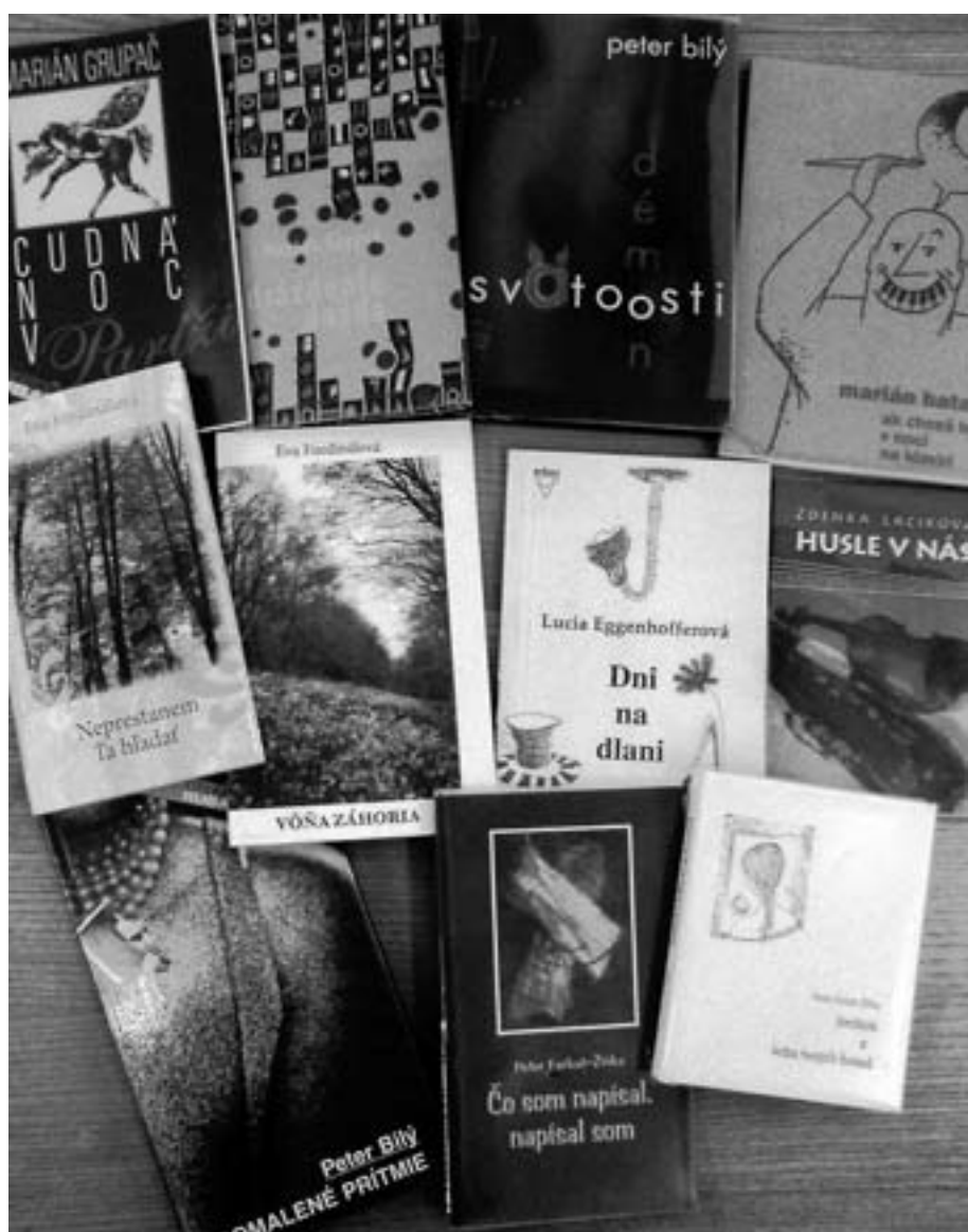
Výber z edičnej produkcie účastníkov predchádzajúcich ročníkov Literárnej Senice