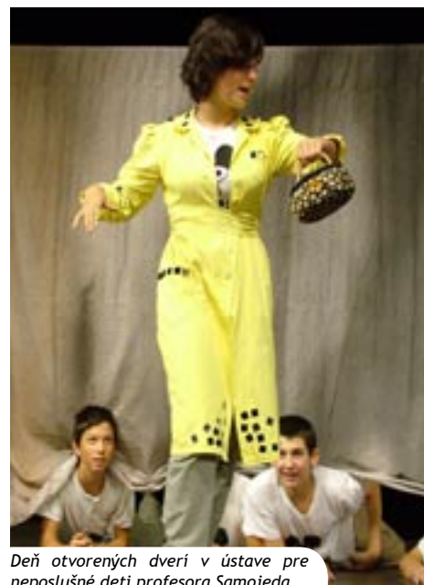
Deň otvorených dverí v ústave pre neposlušné deti profesora Samojeada