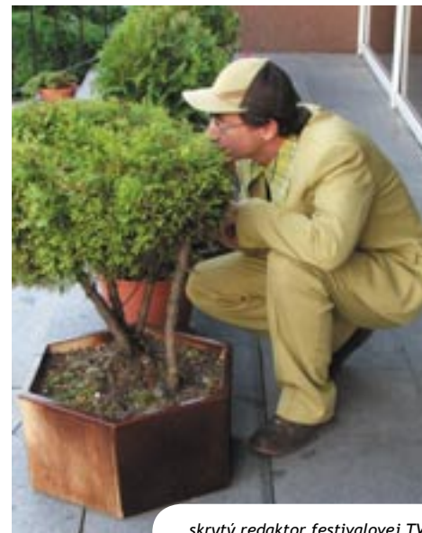
skrytý redaktor festivalovej TV