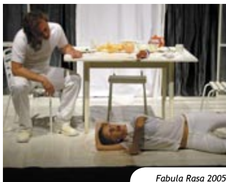
Fabula Rasa 2005