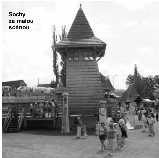
Sochy za malou scénou