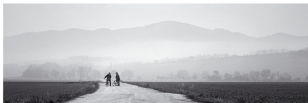
Belas Karol Leto Prelet Rozhovor Rozdelená krajina Piešťany, Trnavský kraj