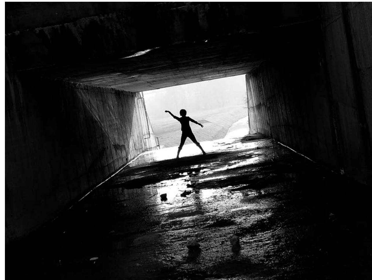
Meleg Matej Hľadám cestu ... III Myjava, Trenčiansky kraj