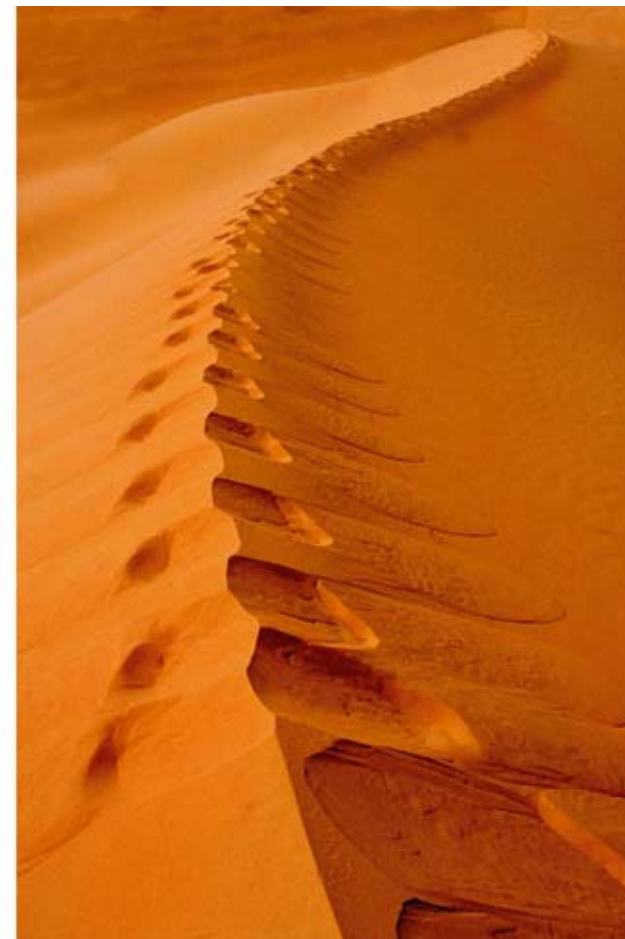
Zahornacký Ján Púšť - 1, 2 Košice, Košický kraj