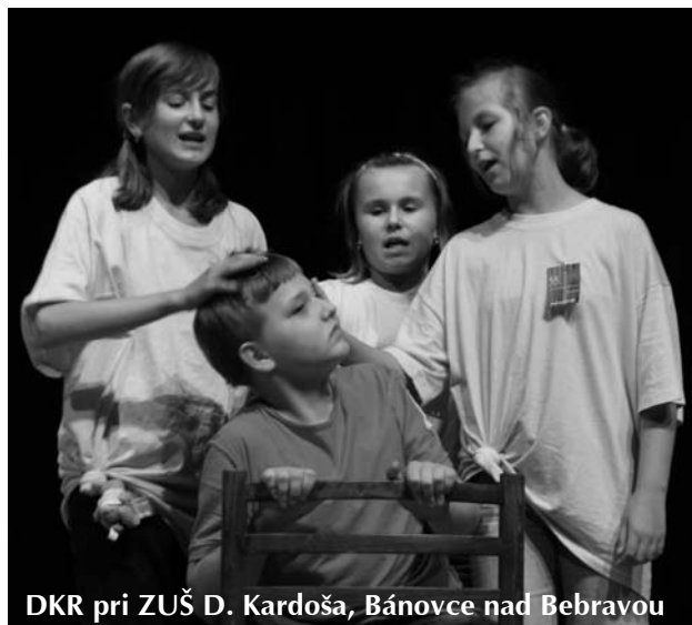
DKR pri ZUŠ D. Kardoša, Bánovce nad Bebravou

Po niekoľkých účastiach na HK s recitátormi som prvý raz cestovala so súborom. Všetko bolo dnes veľmi hektické, vrátane cesty z Bánoviec spojovým autobusom. Našťastie sa nám pri viacerých prestupoch nikto nestratil. Po príchode do Dolného Kubína to pokračovalo v takom istom tempe - skúška, ubytovanie a hneď predstavenie. Vždy sa všetko dialo veľmi rýchlo, ale všetko bolo fajn. Z predstavení sa mi páčili veľmi milé Kozliatka, veľmi milo ma prekvapilo Ach, jáj... Najmä to, ako tento pre mňa dobre známy text zvládli a ako boli dievčatká veľmi dobre disponované. Trocha som sa strácala v predstavení Tanec na streche a výpovedou troch dievčat, ktoré chceli odhaliť svoje vnútro. Ale s prvým dňom som veľmi spokojná a teším sa na ďalšie. (ml)