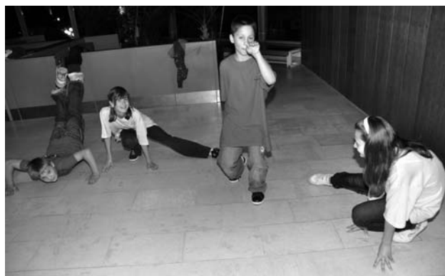
Zo štvrtkovej večernej diskotéky v MsKS.