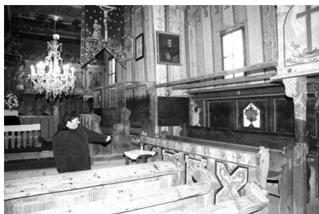
V artikulárnom kostolíku s Leštínach.

Druhá z plánovaných exkurzií je nasmerovaná do hájovne pod Babou horou, kde Hviezdoslav umiestnil dej lyricko-epickej drámy Hájnikova žena. Organizátori pozývajú na sobotu o 14.00 h.